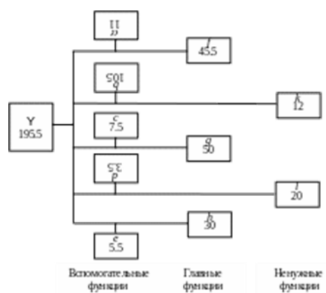
Рисунок 3 - Функционально-стоимостная модель объекта Y до анализа.

В результате анализа выяснено: функцию 1 и дополнительную ей функцию d можно сократить. Вместе с тем сокращение функции k невозможно, потому что она является результатом технологического несовершенства объекта, что обусловлено сегодняшним положением науки. Кроме того, выяснилось, что главная функция f может выполняться другим способом (новое техническое решение). Её стоимость в этом случае несколько больше (70 тыс. руб.), но при реализации возникает необходимость в замене вспомогательной функции a на вспомогательную функцию r, стоимостью 2,5 тыс. руб. Главные функции g и h можно объединить, при этом стоимость этой новой (объединенной) функции составляет 12 тыс. руб. При этом отпадает потребность в функции e.