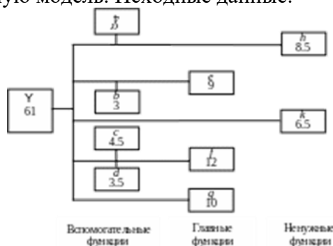
Рисунок 1 - Функционально-стоимостная модель объекта Y до анализа.

1. Провести Функционально-стоимостной анализ (ФСА) объекта, определить сумму и процент возможного сокращения стоимости объекта, построить новую функционально-стоимостную модель. Исходные данные: