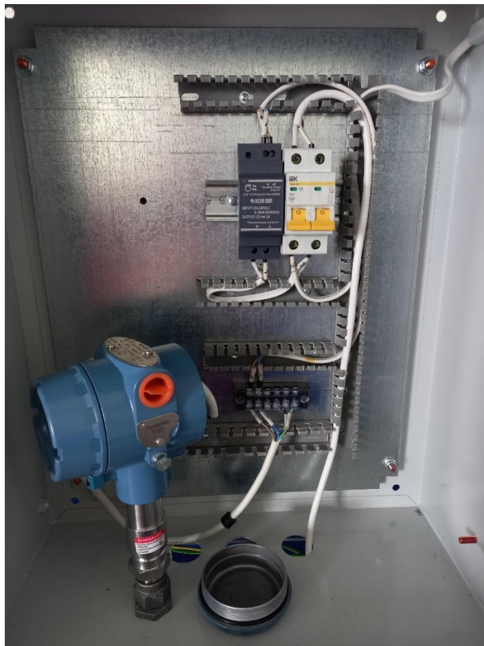
Рисунок 1 – общий вид