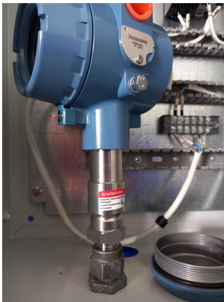
Рисунок 2 – крепление датчика