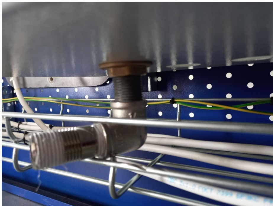
Рисунок 3 – Монтаж комплектующих